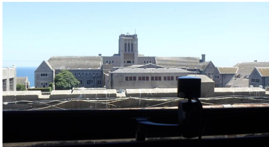
Figura 9: Camara USB capturando vista de la universidad

En la Figura 9 se muestra a la cámara USB capturando una toma de muestra y en la Figura 10 esta es reproducida por la TV del laboratorio a través del set-top box EITV.