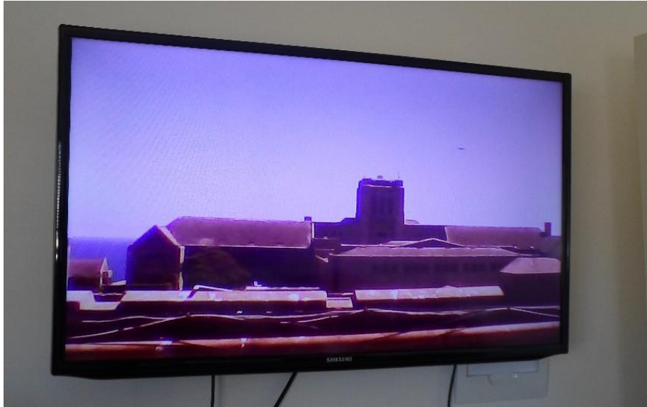
Figura 10: TV sintonizando transmisión en vivo a través del set-top box EITV